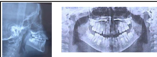
Figure 4 : Téléradiographie de profil et panoramique après traitement orthopédique :