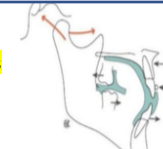
Figure 7: mode d'action de l'activateur