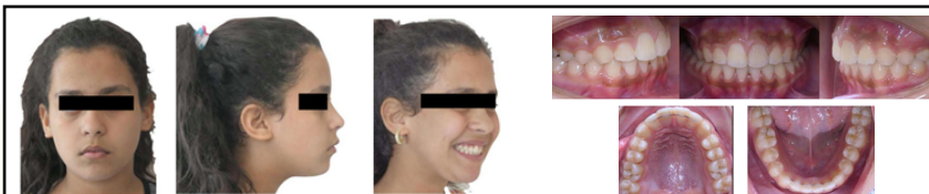
Figure 5 : Photographies extra-orales et intra-orales après traitement orthodontique.