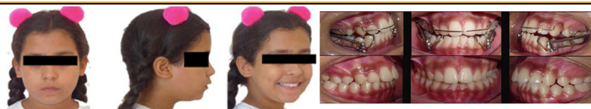
Figure 3: Photographies extra-orales et intra-orales après traitement orthopédique: