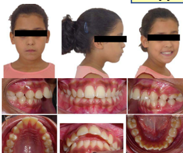
Figure 1: Photographies extra-orales et intra-orales avant traitement.